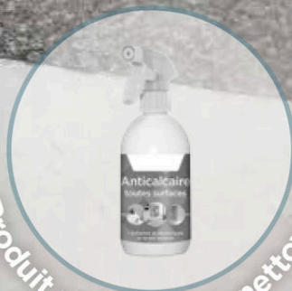
Produit universel de nettoyage