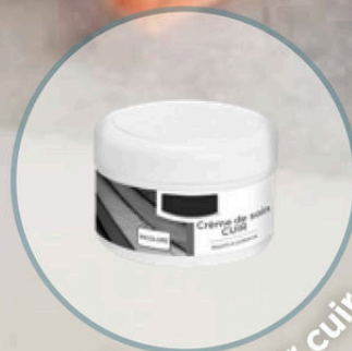
Crème pour cuir